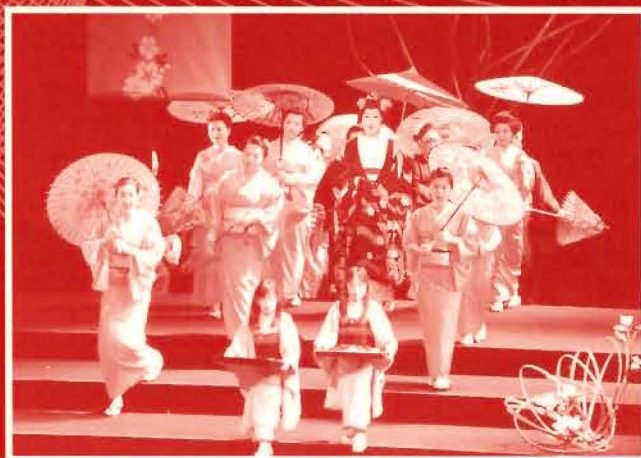
第2回県民オペラ「蝶々夫人」より

第24回国民文化祭・しずおか2009のシンボルイベント「THE オペラ」として、また静岡県ゆかりのプリマドンナ三浦環生誕125周年を記念した「第3回県民オペラ」として、プッチーニ作曲のオペラ「蝶々夫人」<全2幕>（原語）の公演を来年10月、アクティシティ浜松大ホールにおいて行います。この公演に合唱で出演される方を広く募集します。