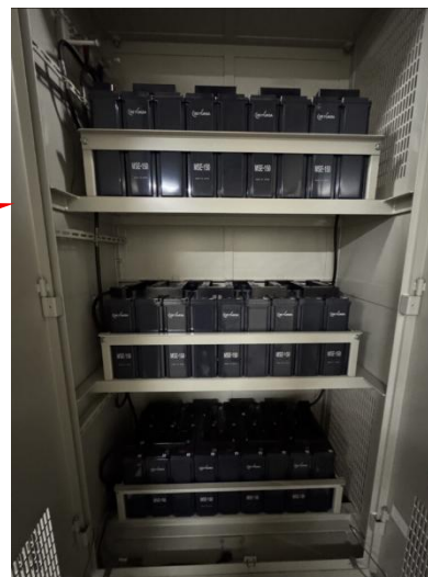
蓄電池 54 個を格納