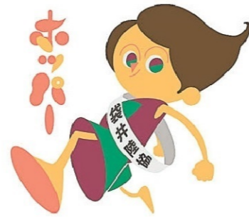
袋井市陸上競技協会のキャラクター「ホッパー」