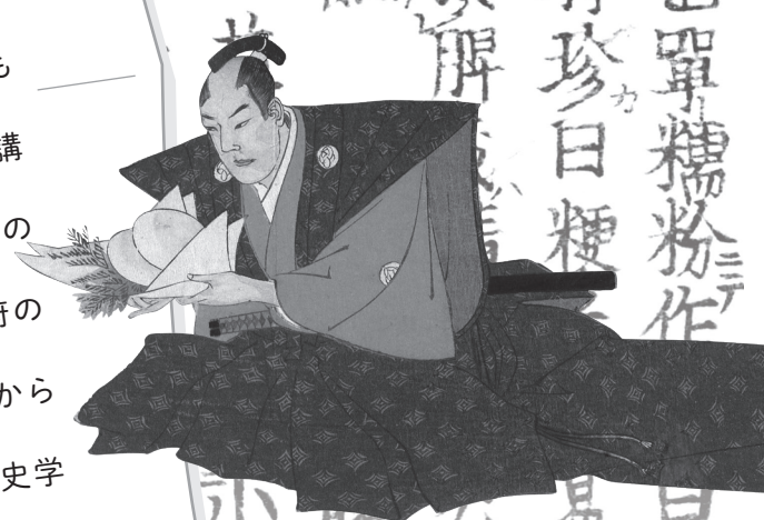
楊洲周延「千代田之御表」[六月十六日嘉祥ノ図](東京都立図書館/部分) 福田松珀「増補日用食性」(国立国会図書館デジタルコレクション)