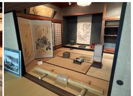
(写真) 旧田代家住宅