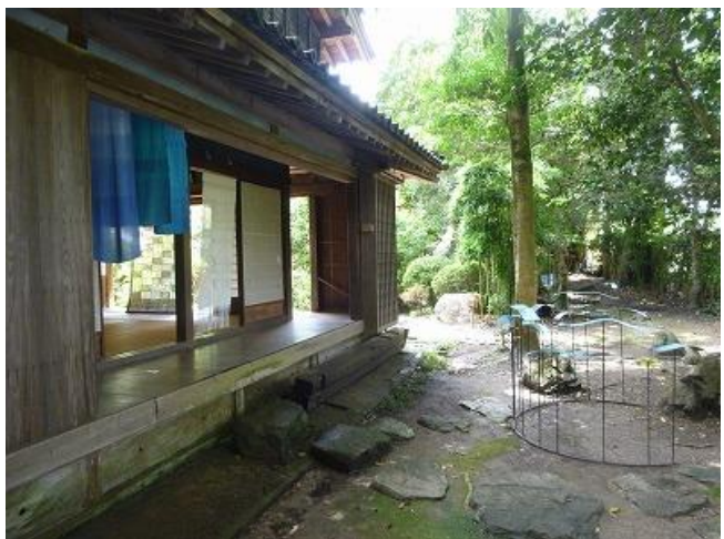
（写真）昨年度実施の様子