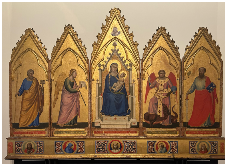
Pinacoteca Nazionale di Bologna

ルネサンスからバロックまで たくさん作品が展示されている 時間がいくらあっても足りない!!