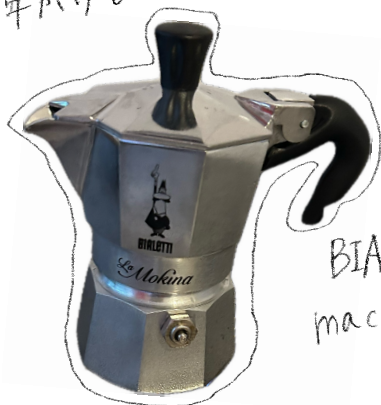
BIALETTI の macchinetta