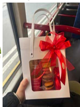
もらったプレゼント