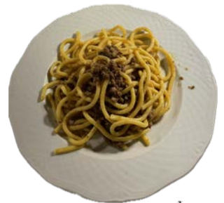
もちもちビュッリ