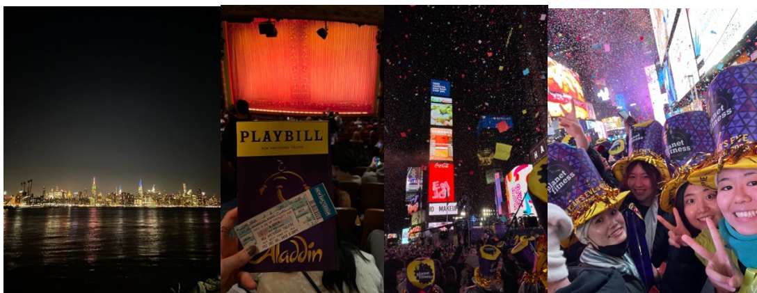
ダンボからの夜景

の瞬間は通り一帯が地響きのような歓声で満たされました。総じて楽しいイベントでしたが、人生に一回でいいというのが正直な感想です。