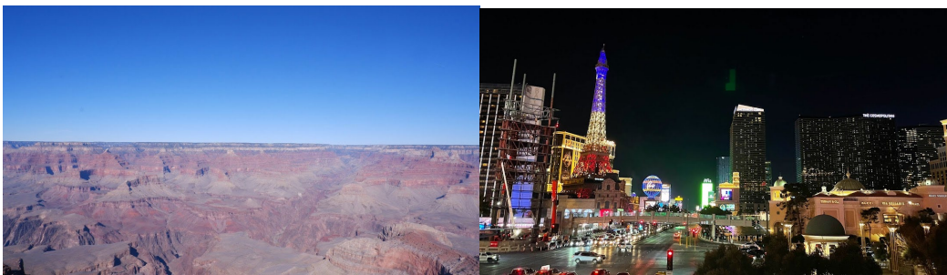
グランドキャニオン

ラスベガスのストリップはとても煌びやかな世界で世界各地からの観光客で溢れていました。驚いたのは治安の良さと街の綺麗さです。ラスベガスを代表するカジノそして勿論飲酒の年齢も 21 歳ですが、様々な噴水ショーや雰囲気でも 20 歳の私でも十分に楽しめました。