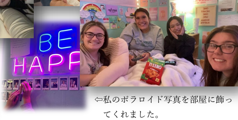
←私のポラロイド写真を部屋に飾ってくれました。