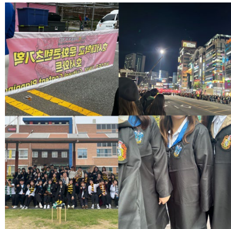
衣装のローブがかわいかったです

「祝祭企画実習」の授業で、ホソワットを宣伝するためにフンタリョンという町のダンスパレードのような祭りに参加しました。ハリーポッターに出てくる4つの寮の雰囲気に合わせたダンスを披露しました。本番の3日前から毎日二時間程度ダンスを練習に参加し、韓国人学生にダンスを教えてもらいながら一生懸命練習しました。本番は、思っていたよりも観客が多くてとても緊張しましたが、楽しく踊れました。また、町のお祭りにも参加でき、良い経験になりました。