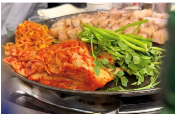
バレーボール終わりに食べに行った サムギョプサル