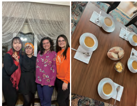
友人の家でスープ会をしました。友人のお母様の好きなスープを飲むことができて幸せでした。