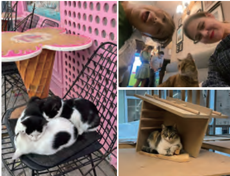
街にはそこら中に猫ちゃんが落ちています。学校内やカフェ、レストランにもいます。

留学生活最後の月例報告書です！今月は総集編ということで写真を中心に生活を簡単に紹介します。