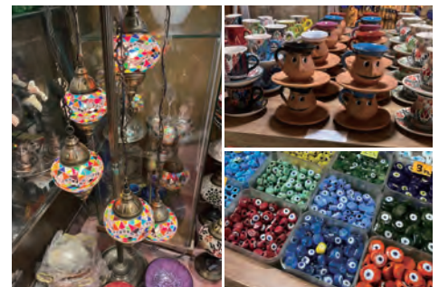
ケメルアルトゥという場所にはかわいい小物や'日用雑貨が安い値段で販売されています。