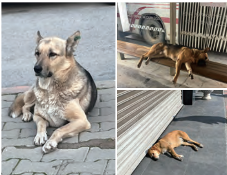
そこら中に犬も落ちています。よく寝ています。生まれ変わるならトルコの犬になりたいです。