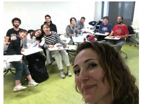
日本のクラスです。私は数回しか行きませんが、みんな優しくて居心地がいいです。