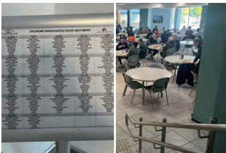
学食なのですが1ヶ月のメニュー表が食堂の入り口に立てかけてあります。