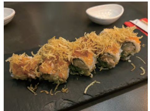
日本食レストランで食べた寿司。美味しいですが割高です。握り寿司ではなくロールがポピュラー。