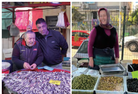
市場にいったときの写真です。喜んで写真に写ってくれました。かわいいです。