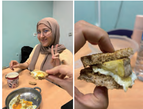
寮で仲良くなった子とランチ。寮にはフリースペースがあるのでそこで自由におしゃべりできます。