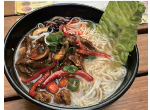
アジア料理屋さんで頼んだ肉ラーメン。はっきり言えること、これはラーメンではない。