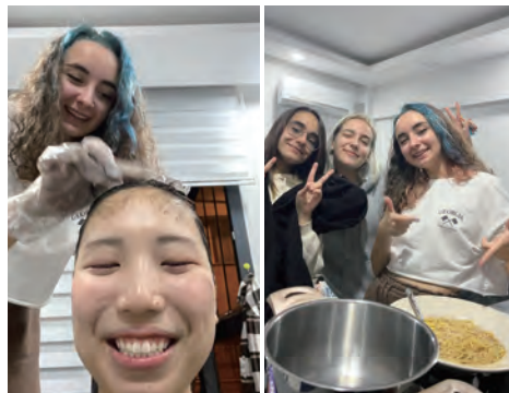
髪色が抜けていたので友人宅で髪を染めてもらいました。ついでにラーメンと団子を作りました。