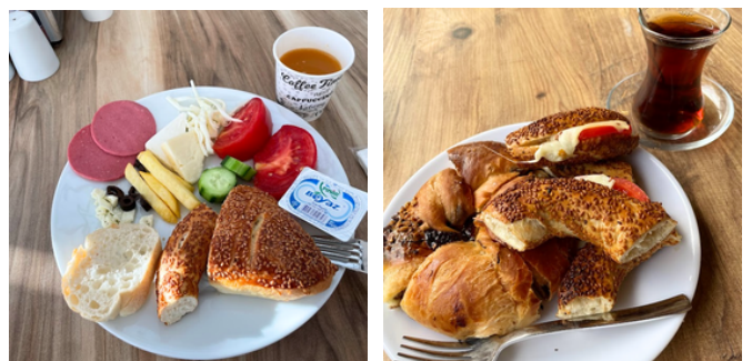
ホテルの朝ごはんとパン屋のパン。パンがおいすぎます。

私は12月の留學説明会に参加し、そこでイズミル経済大学の説明を受けて興味を持ち応募しました。内定を受け4月になると様々な手続きがありました。が仲間や教務学生室の方の協力のおかげで乗り切ることができました。日本国内での手続きはスムーズにいきますが、トルコの大学を通じての手続きの際に時間がかかったり、申請した期間と異なる書類が来たりと困ることが多々ありました。これに関しては何度もお願ひしたり、焦らず待つしかありません。一番困ったのは、大学の寮に入る予定だったのですが8月下旬に寮が定員オーバーで入れませんと連絡がきたことです。留學開始まで1か月切っていたのでとても焦りましたが、Facebookで大学に近いアパートを見つけることができ、今は3人で仲良く暮らしています。