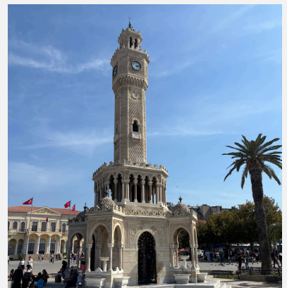
イズミルのシンボル CLOCK TOWER です