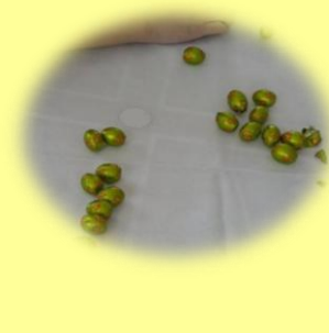
庭に小さいチョコエッグ を隠して子供が探す遊び