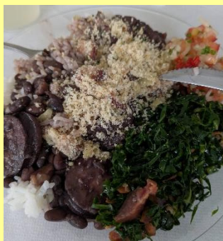
日：Feijoada (豆と肉の煮込み)