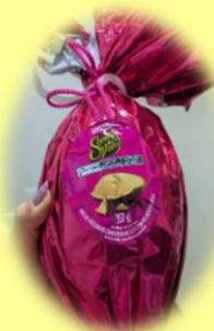
Ovo de Páscoa (チョコエッグ)