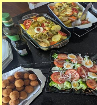
金：bacalhoadinha (タラのオープン焼き)

ブラジル全体で休暇になるため、行政サービスや店が営業していないことや、旅行に行く家族も多いため、交通渋滞などにも注意を払う必要があります。