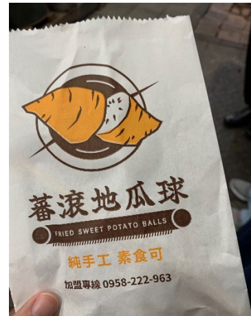
地瓜球（サツマイモボール）