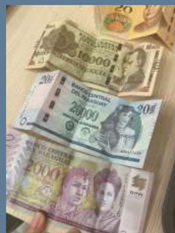
パラグアイのお金↑