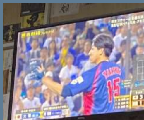
日台戦は日本式居酒屋のテレビで観戦しました^^

17日と18日は天母野球場という少し遠い球場で試合がありました。どの試合も、日本人側の座席には半分以上台湾人が座っていました。台湾人は本当に野球が好きみたいです。17日18日の試合は終盤で追いつかれたり、ピンチを迎える場面が多く、雨でコンディションも悪かったので、応援したい気持ちが高ぶったのか、中国語での応援の声の方が大きかったです。日本の応援団も頑張っていました^^もちろんわたしも^^再来一個好球 三振 三振 (zài lái yī gè hǎo qiú sān zhèn sān zhèn)