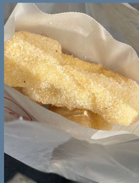
↑ 白糖粿 あまい