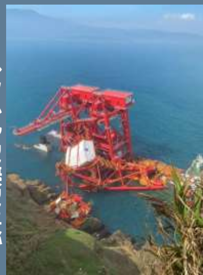
10月末の台風によって 壊れた船だそうです