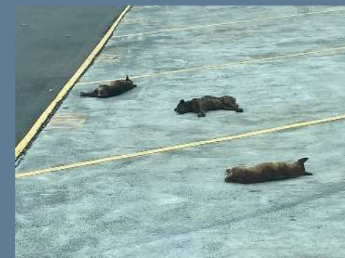
↑ ひなたぼっこ猫ちゃんたち