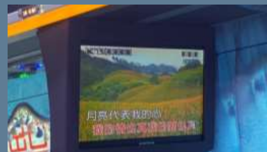
↑ 中国語の授業で聞いた 月亮代表我的心