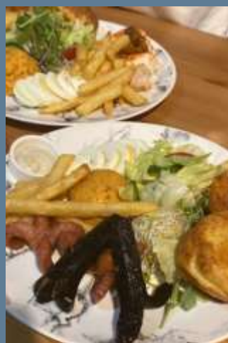
学校帰りに食べたプレート とクレームブリュレ

MTCの授業を取っていないので、初回授業で声をかけたり、学校主催のパーティーに積極的に参加して、積極的に交流を図るようにしています。学校帰りにカフェに行ったり、午後の授業がなくても学校でだれかと学食を食べるようにしたりしています。基本的に断らないということを意識しています。ほかにも、お昼を誰かと食べていると、途中からその子の友達が合流してきたりするので、どんどん友達ができます。ほかの国の人と話すことで、その人の国について理解を深めることができますし、お互いの中国語力向上にもつながるので、とにかく自分から積極性を、ということ心がけています。ここで出会った人は、留学しなければ絶対に出会えない人たちで、それぞれ全く異なる背景を持っていて毎日が新鮮で刺激的です。10以上の言語を話せる人や、今まで40か国以上言ったことがある人など、個性豊かな人がたくさんいて一緒に話していると話題が尽きなくて本当に楽しい日々です。