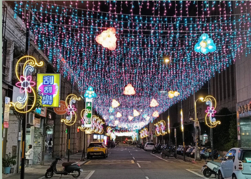
ホテル周辺の春節時の写真