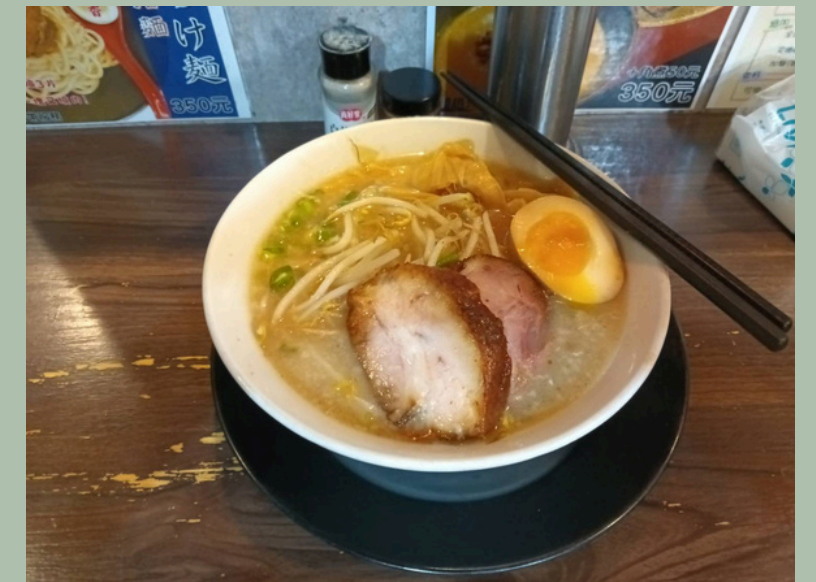
台湾に来て最初に食べたものは「味噌とんこつラーメン」！！ 美味しかった。