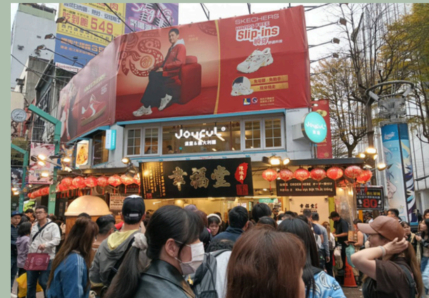
台湾で有名なタピオカミルクティー（珍珠奶茶）のお店 幸福堂