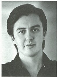
〔指揮〕 デニス・ヴラセンコ