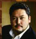
ベット 三戸 大久